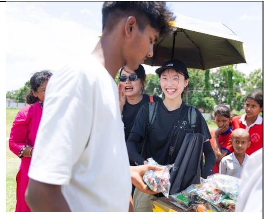
圖片四：透過遊戲園遊會發放募集的文具與物資給當地孩童。