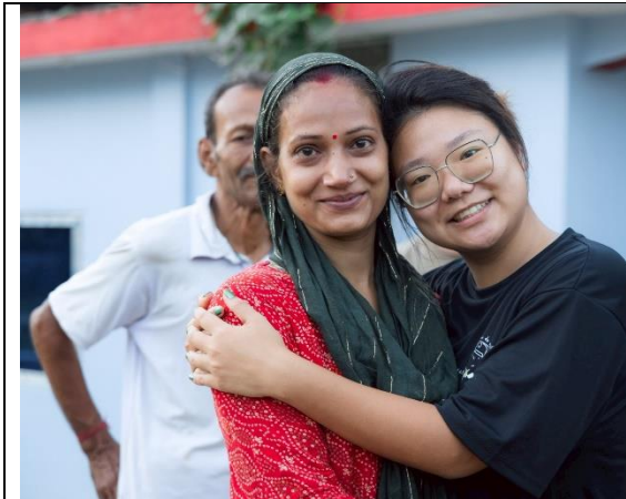
圖片三：學生與接待家庭建立深厚的感情。