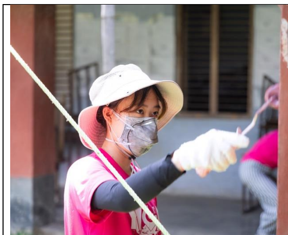
圖片一：學生粉刷破舊牆面，改善在地學習環境。