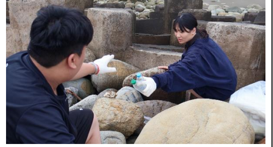
圖片六：苗栗苑裡淨灘