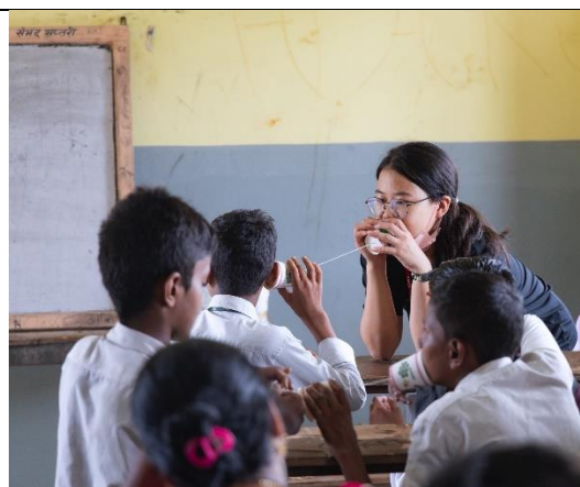
圖片二：團隊帶領尼泊爾學童進行創意科普課程。