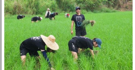
圖片五：苗栗通霄石虎田下田挲草