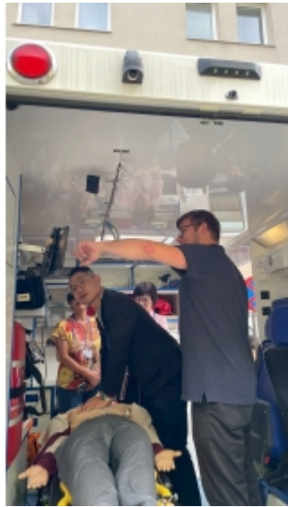
↑ 學生到捷克醫院救護車上學習。