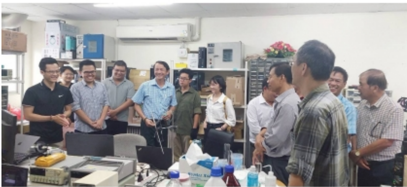
↑ 越南醫療團參訪生醫工程研究所實驗室