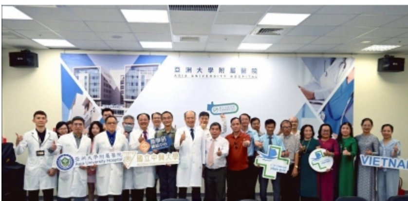
↑ 越南醫療團參訪亞大醫院大合照