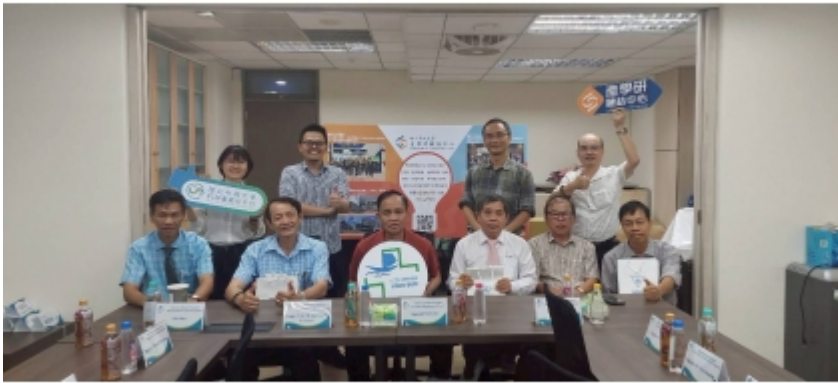
↑ 越南醫療團參訪產學研鏈結中心