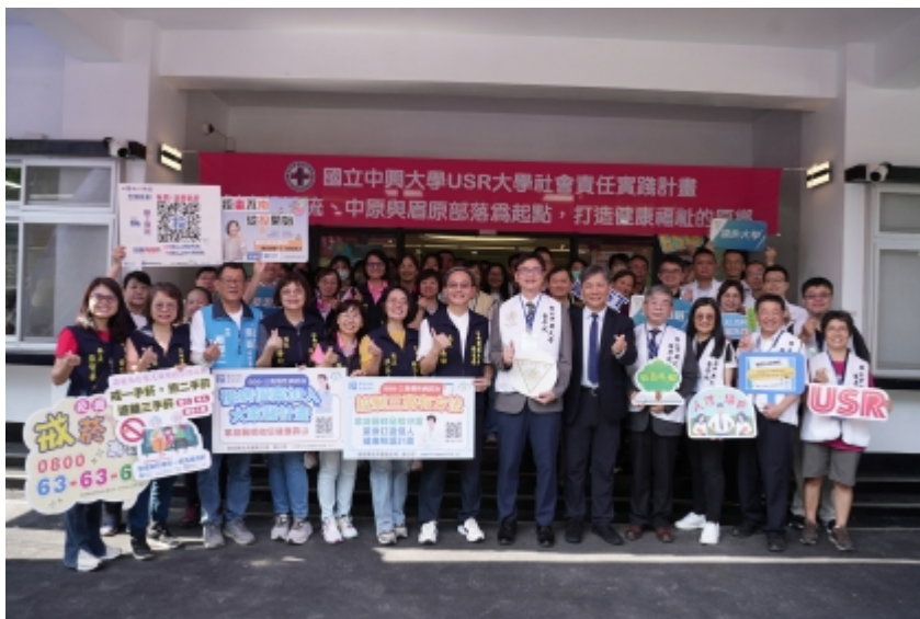
↑ 興大醫學院結合彰基與南投縣衛生局 中興新村首辦義診