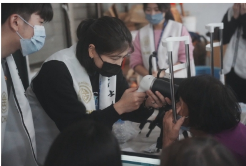
↑ 為居民進行AI輔助眼底影像分析檢查。