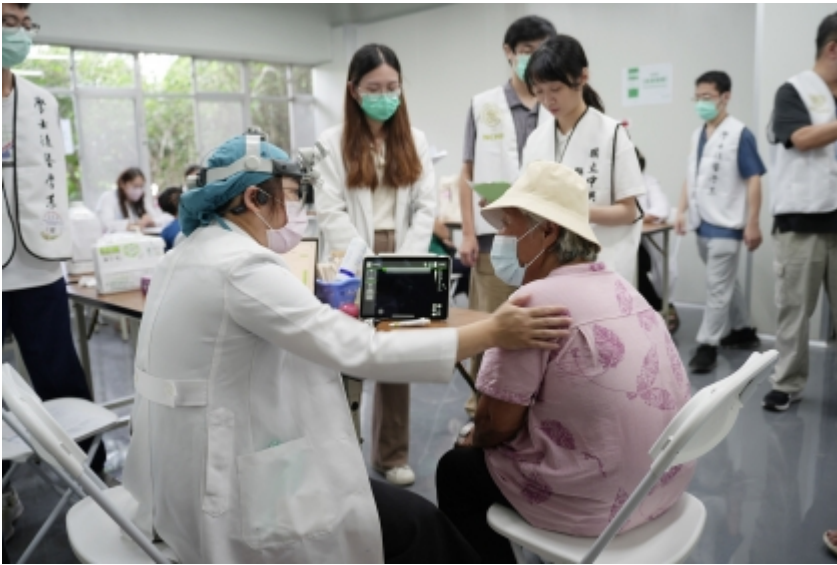
↑ 興大醫學院結合彰基與南投縣衛生局 中興新村首辦義診