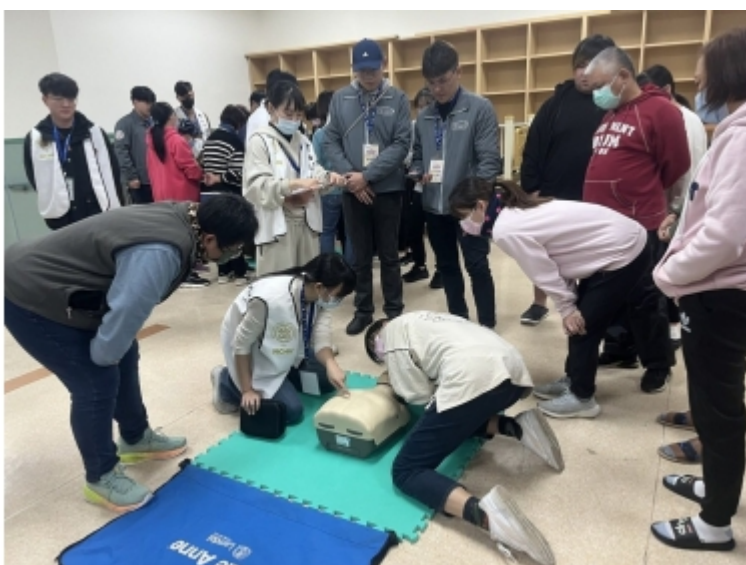
↑ 童綜合醫院醫師帶領中興大學後醫學系學生到德水園身心障礙教養院幫員工進行CPR教學... 童綜合醫院醫師帶領中興大學後醫學系學生到德水園身心障礙教養院幫員工進行CPR教學。