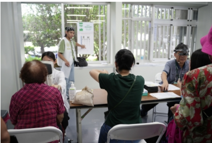
↑ 興大醫學院結合彰基與南投縣衛生局 中興新村首辦義診