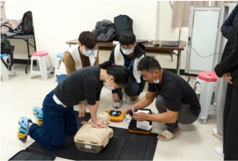
↑ 教導綠島居民基本救命術(BLS)及自動體外心臟電擊去顫器(AED)操作。