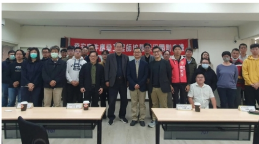
↑ 2024年「資安事件應變工程師」課程開訓資料照

https://www.nics.nat.gov.tw/latest_news/announcements/Latest_Announcement/announcements_1751/