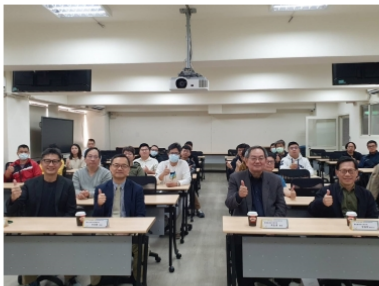
↑ 2024年「資安事件應變工程師」課程開訓資料照