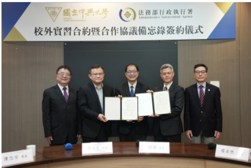
↑ 左至右：中興大學詹富智校長、法律專業學院陳信安院長、法務部鄭銘謙部長、法務部行政執行署彰化分署郭景銘分署長、法務部行政執行署繆卓然署長。