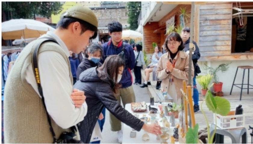
↑ 提供微型創業團隊商業驗證機會(審計新村暮暮市集)。