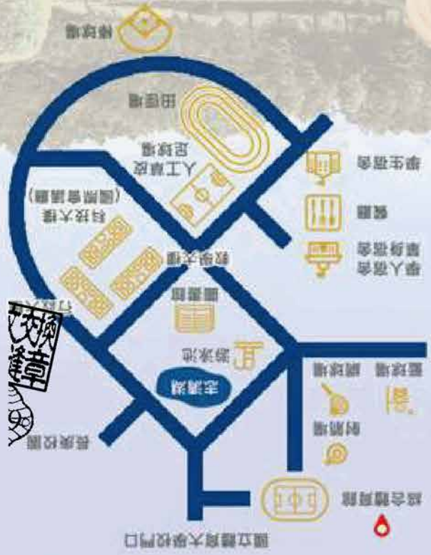
國立體育大學校內位置圖